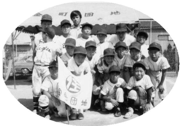
団地の子供野球チーム(S40年代) 勝っても？ 負けても元気一杯